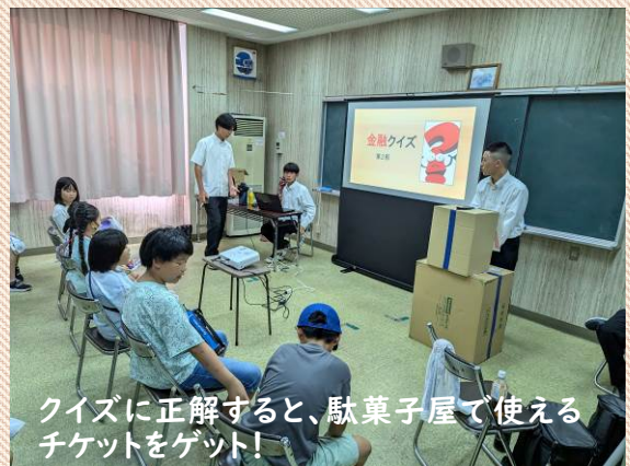
クイズに正解すると、駄菓子屋で使えるチケットをゲット!