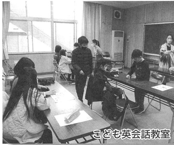
こども英会話教室