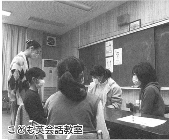
こども英会話教室