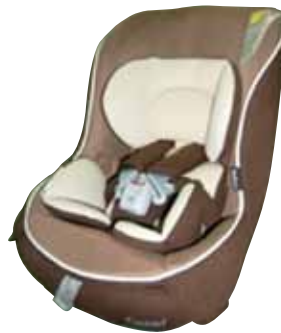
チャイルドシート

ご利用される皆さまにはご迷惑をおかけしますが、何卒ご理解いただきますようお願い申し上げます。