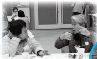
茶話会で楽しく意見交換♪