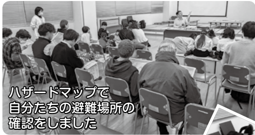
ハザードマップで自分たちの避難場所の確認をしました