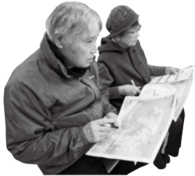
大人の方も一緒に講座を聞き下津町の防災について考えました