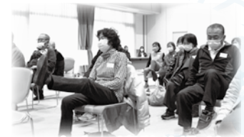
みんなで簡単体操!!