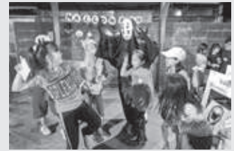
ハロウィンイベント大盛況！