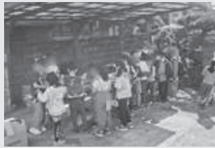
屋外での開催も楽しそう♪