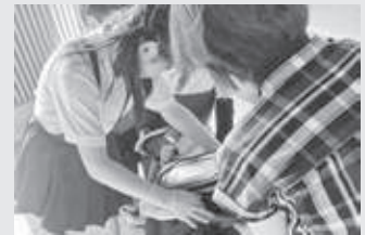
お弁当配布の様子