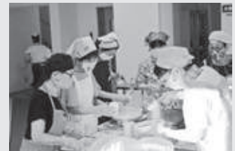
手際よく作っています！