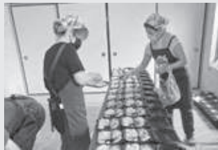
地元産の食材を利用して