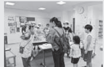
にぎわう会場の様子