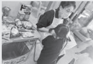
更生保護女性会もお手伝い☆