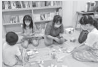
工作教室も毎回人気！