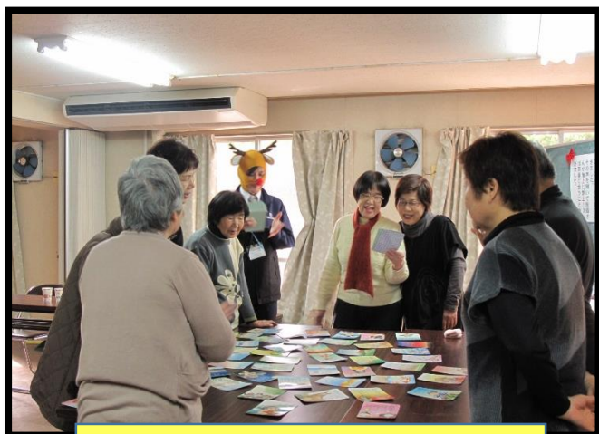
思い出カルタで和気あいあい♪

「みんなと話せるから、行くと笑顔になる！」「出かけるきっかけになった」 ふれあい・いきいきサロンは、あなたの地域の居場所づくりです。