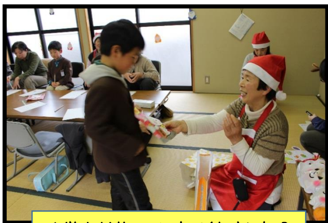
小学生がサロンに来てくれました♪