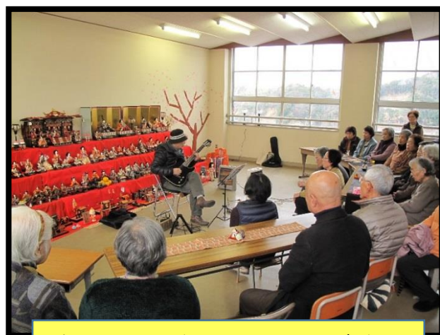
ボランティアさんがマンドリン演奏♪