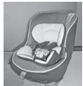
チャイルドシート