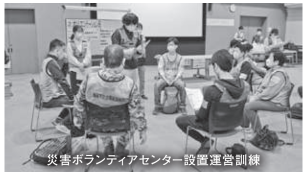
災害ボランティアセンター設置運営訓練

市と共催で実施した防災訓練では、海南高校生、和歌山信愛大学生、防災士、災害ボランティア登録者、NPO法人等と連携を図りながら、和歌山県看護協会研修センターにおいて災害ボランティアセンター設置運営訓練を実施したほか、巽中学校体育館では災害ボランティア活動訓練を実施しました。また、県社会福祉協議会主催の「中核スタッフ養成研修」に参加し、災害ボランティアセンターの運営に関する知識を深めるとともに、県内の防災活動者との関係づくりに努めました。