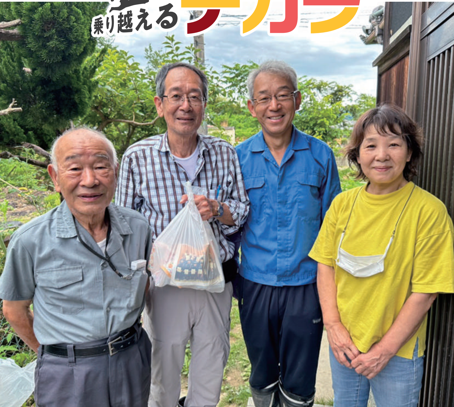
太地町立太地中学校の生徒の皆さんが袋詰めしたメッセージ入りの『よりそいパック』を受け取り、 笑顔を見せてくれたボランティア活動先の皆さん