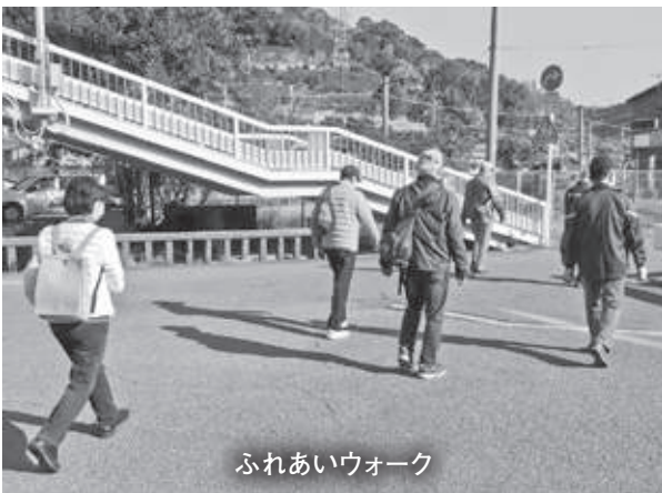
ふれあいウォーク

近所のつながりも弱くなっている中、コロナで外出の機会が減っていることから、誰でも気軽に参加できるイベントで楽しんでもらえるよう、「ふれあいウォーク」を開催しました。また、サロンやラジオ体操などの活動場所を訪問・取材し、地域資源の把握、情報共有に努めました。