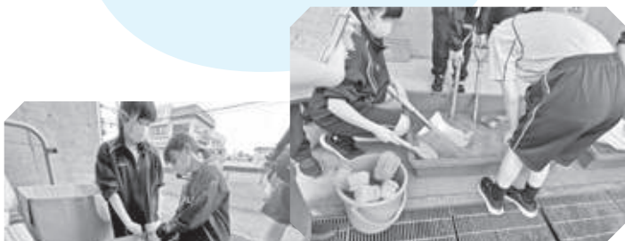
太地町立太地中学校の生徒のみなさんが手伝いに来てくれました。