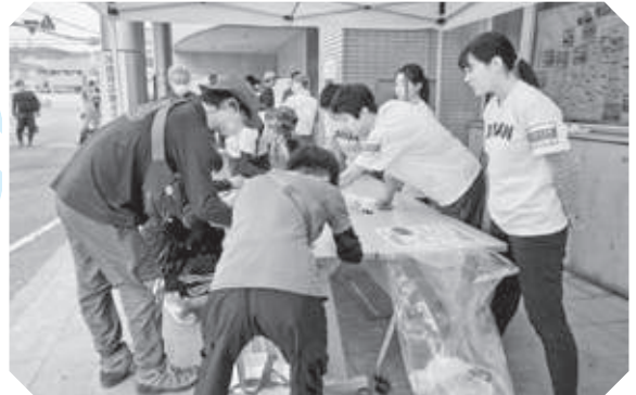
県立海南高校の生徒会のみなさんが手伝いに来てくれました。