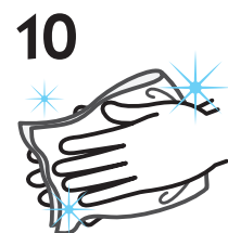
10 きれいに拭きます

石けんで洗い終わったら、十分に水で流し、清潔なタオルやペーパータオルでよく拭き取って乾かします