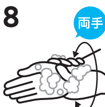
8 両手 手首をもう片方の手で包みねじり洗います