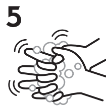
5 指を組んで両手の指の間をもみ洗います