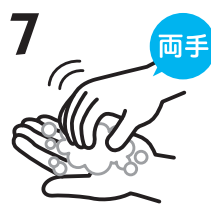
7 両手 指先をもう片方の手の平で洗います