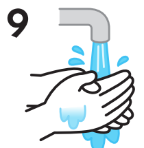
9 流水でよくすすぎます