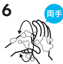
6 両手 親指をもう片方の手で包みねじり洗います