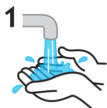
1 手指を流水でぬらします