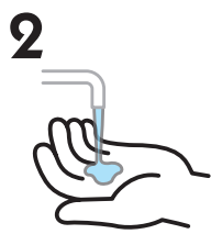
2 石けんを手にとります