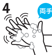
4 両手 手の甲をもう片方の手の平でもみ洗います