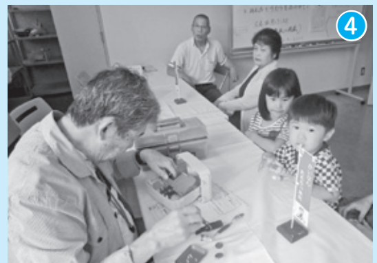
子ども × 地域ボランティア