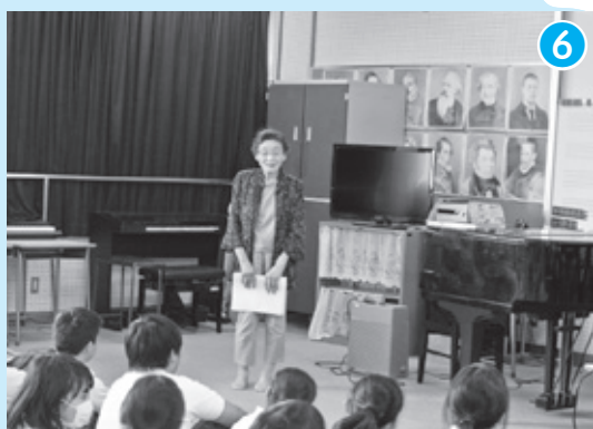
亀川中学校 × 地域関係団体