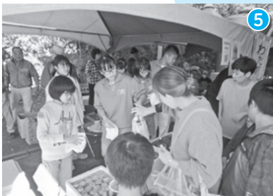
下津第一中学校 × 大東小学校 × 地域住民