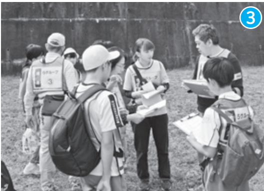
学生 × 福祉系専門職 × ボランティア × 地域住民