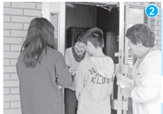
内海小学校 × 地域ボランティア