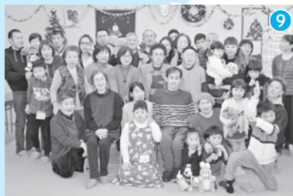
地域住民 × サロン

子どもたちと地域の皆さまとの交流が広がっています。 海南市社協は地域とともにがんばってまいります！！