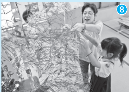
大野小学校 × サロン