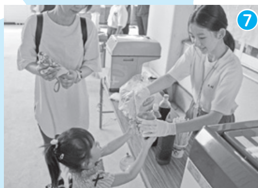
学生ボランティア × 地域住民