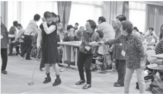
グラウンド・ゴルフゲーム

この交流会は、障害者施設や団体等の方々とボランティアが交流会を通じて親睦を深めることを目的に開催されました。