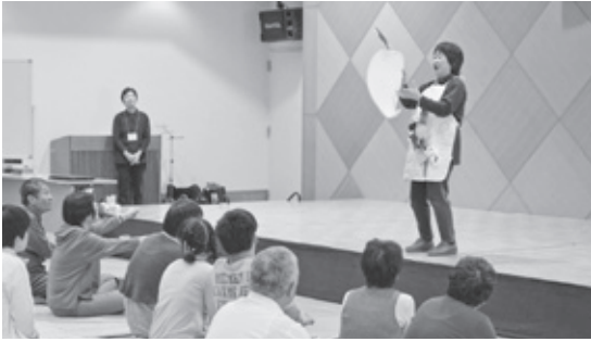
亀川人形劇サークルはちの巣による エプロンシアター

昨年11月2日(土)海南保健福祉センターにおいて、海南市ボランティア連絡協議会海南支部と社会福祉協議会との共催で、令和元年度ふれあい交流会を開催しました。