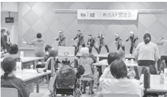
大野フラワーズによるソーラン節

催され、お互いの連帯感の向上とボランティア活動の振興を図っています。午前の部では、亀川人形劇サークルはちの巣による「エプロンシアター」、グラウンド・ゴルフゲーム、ピンポンカップインゲームや災害に関する〇×クイズを行いました。また昼食は、ハンバーク