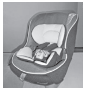
チャイルドシート