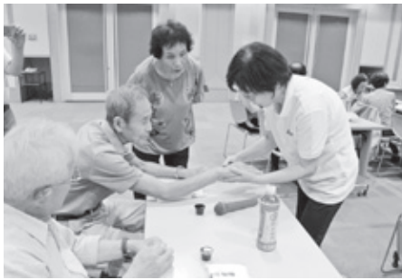
ハンドケア講習の様子

ボランティア活動を行っている皆様には、海南市の地域福祉の推進のために、より一層のボランティア活動の普及にご支援賜りますようお願い申し上げます。